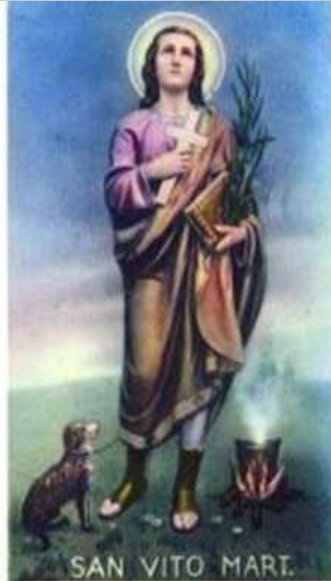
Prameň: Diár pre cirkevný rok 1998 – 1999.

Vít patrí k najpopulárnejším svätcom katolíckej cirkvi. Od 14. storočia je uctievaný ako jeden zo štrnástich pomocníkov – je považovaný napr. za patróna mládeže, ochrany cudnosti, kuchárov, lekárnikov, hercov, vinárov; je vzývaný pri očných a ušných chorobách, najmä proti epilepsii (tzv. choroba sv. Víta). Zobrazovaný býva ako mladík s knihou, levom, kohútom, orlom, a inými atribútmi jeho mučeníctva. V Európe sú známe jeho početné svätyne. Je patrónom Čiech a Prahy, kde sú uchované relikvie tohto svätca.