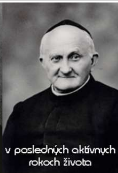
v posledných aktívnych rokoch života

Sv. Arnold Janssen, zakladateľ rehole verbistov a Služobník Ducha Svätého, si počas duchovných cvičení pred kňazskou vysviackou spravil do notesa poznámku: