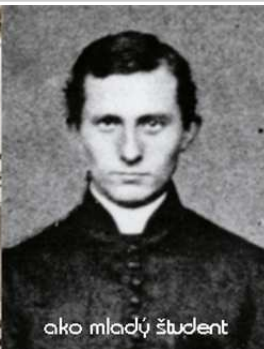
ako mladý študent